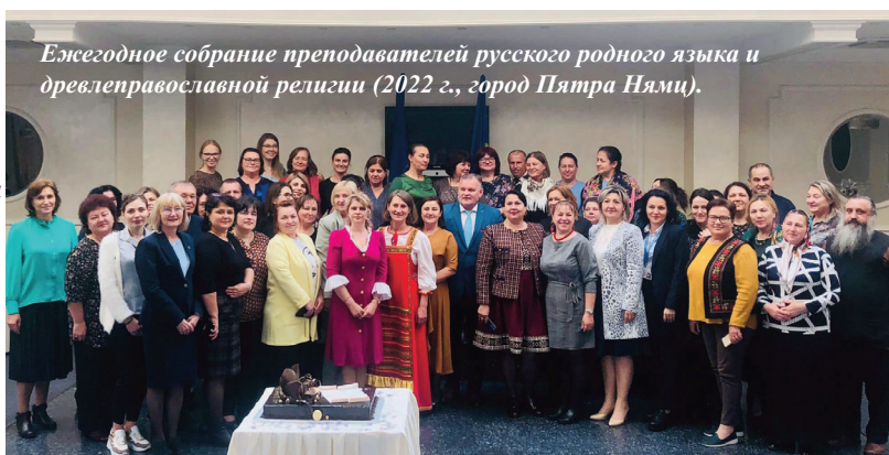
Ежегодное собрание преподавателей русского родного языка и древлеправославной религии (2022 г., город Пятра Нямы).