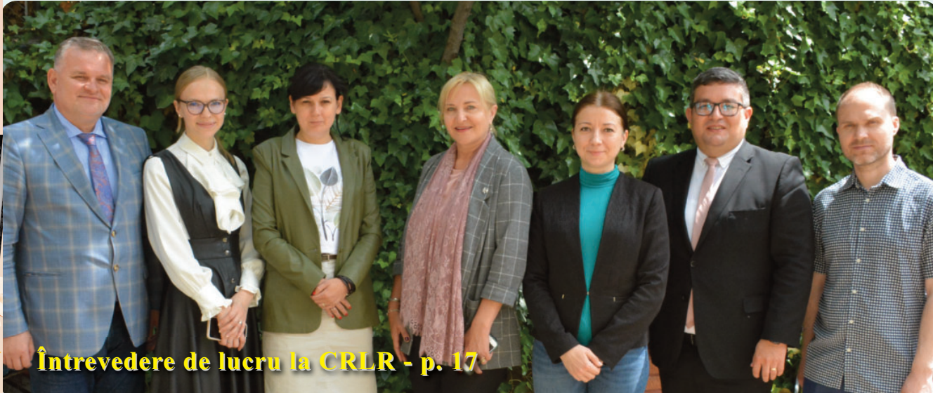
Întrevedere de lucru la CRLR - p. 17